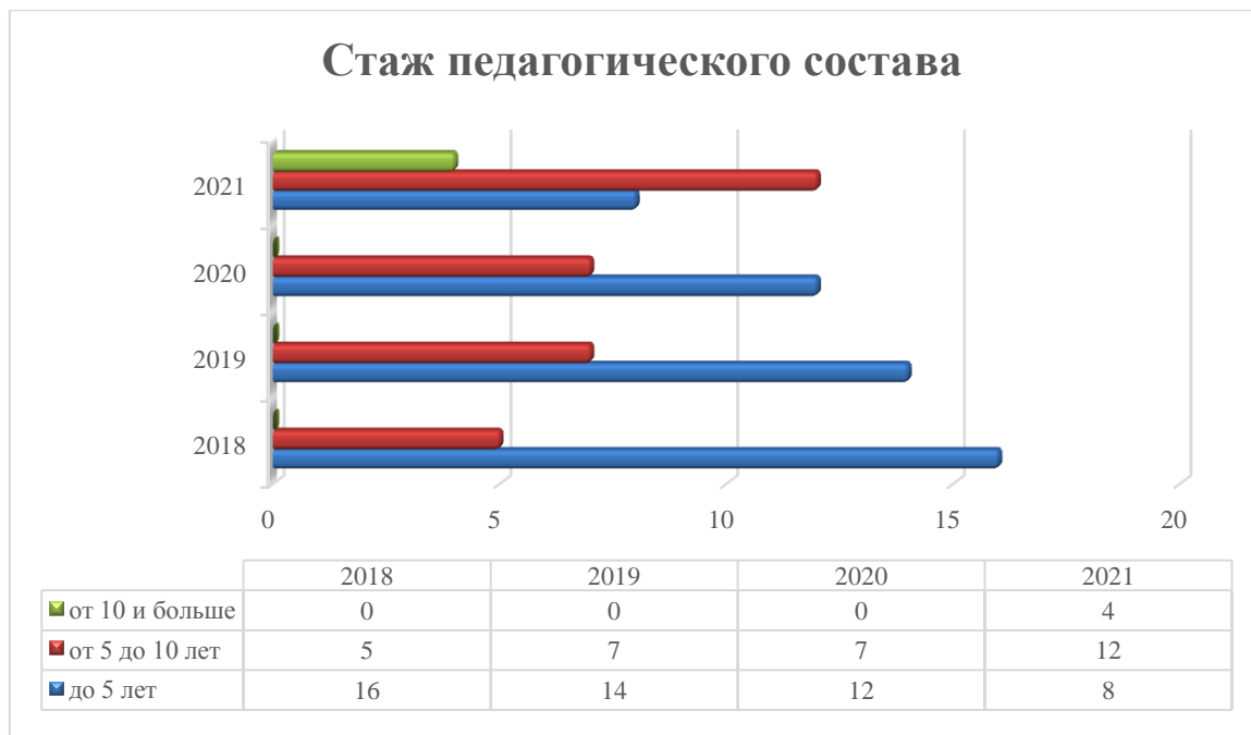
Диаграмма с характеристиками кадрового состава

Курсы повышения квалификации в 2021 году прошли 11 педагогов.